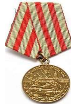
Медаль «За оборону Москвы»