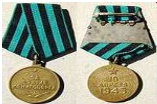
Медаль «За взятие Кенигсберга» "