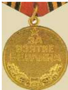
Медаль «За взятие Берлина»