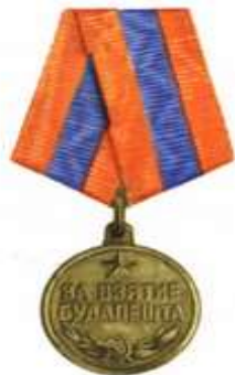
Медаль «За взятие Будапешта»