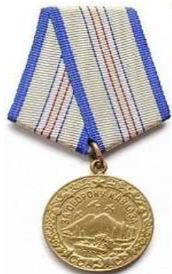
Медаль «За оборону Кавказа»