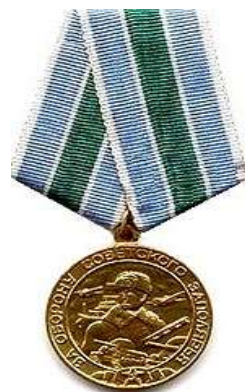
Медаль «За оборону Советского Заполярья»