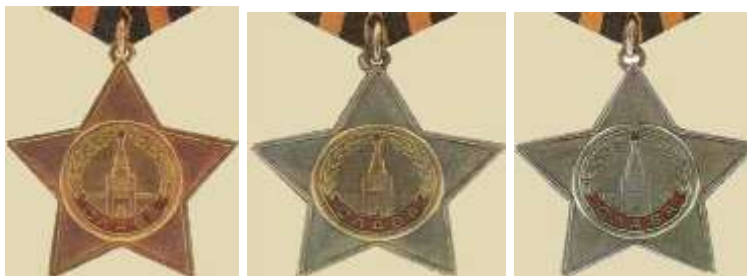
Орден Славы I, II, III степени