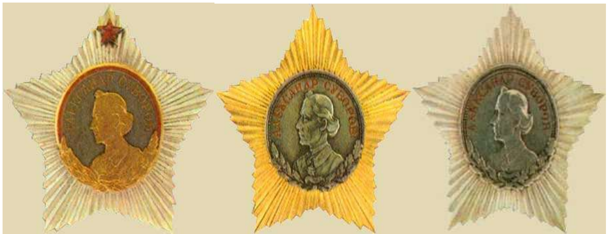
Орден Кутузова I, II, III степени