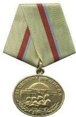
Медаль «За оборону Киева»