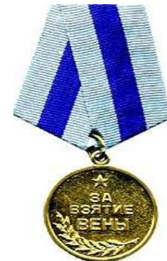
Медаль «За взятие Вены»