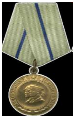
Медаль «За оборону Севастополя»