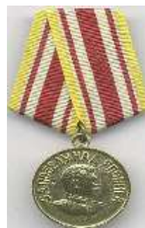
Медаль «За победу над Японией»