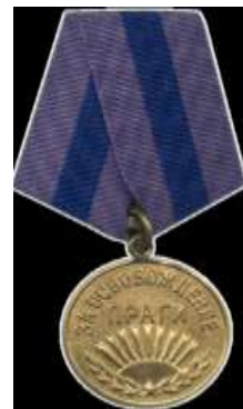
Медаль «За освобождение Праги»