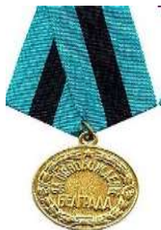
Медаль «За освобождение Белграда»