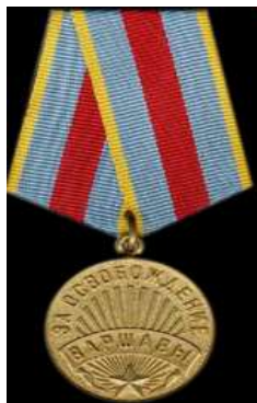
Медаль «За освобождение Варшавы»